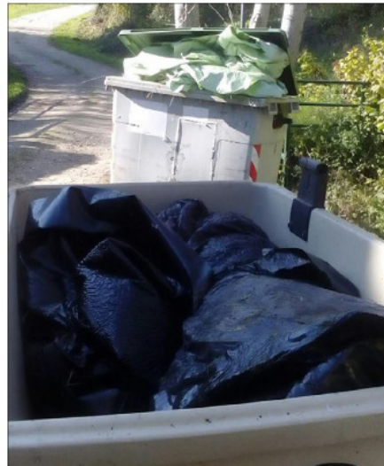
Los plásticos de uso agrícola no siempre acaban en los contenedores. ece

Ante la cantidad considerable de este material que generaban a raíz de su labor profesional, un grupo de ganaderos decidieron aunar esfuerzos en torno a 2010, y buscar una empresa que se lo recogiera y gestionara. La elegida fue entonces la vasca Zorroza Gestión, «con la que volvimos a contactar a finales del año pasado en que nos plantea-